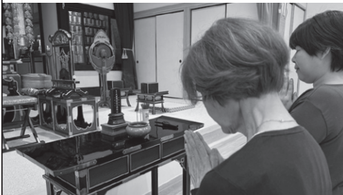
本堂でのお墓参りの様子